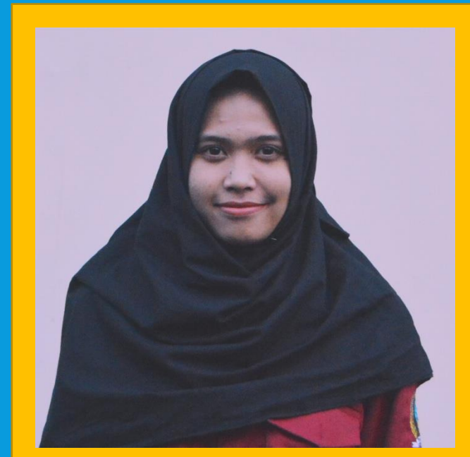
Ninda Kuni Sa'adati Ilmu Kesehatan Masyarakat/2014